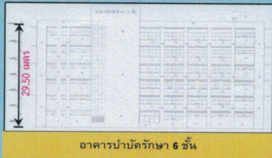
อาคารบำบัดรักษา 6 ชั้น

แบบอาคารที่จะทำการก่อสร้างภายในพื้นที่โรงพยาบาลเพชรบูรณ์